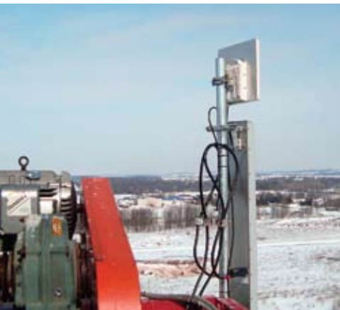
Транспорт в сети WiMAX, США