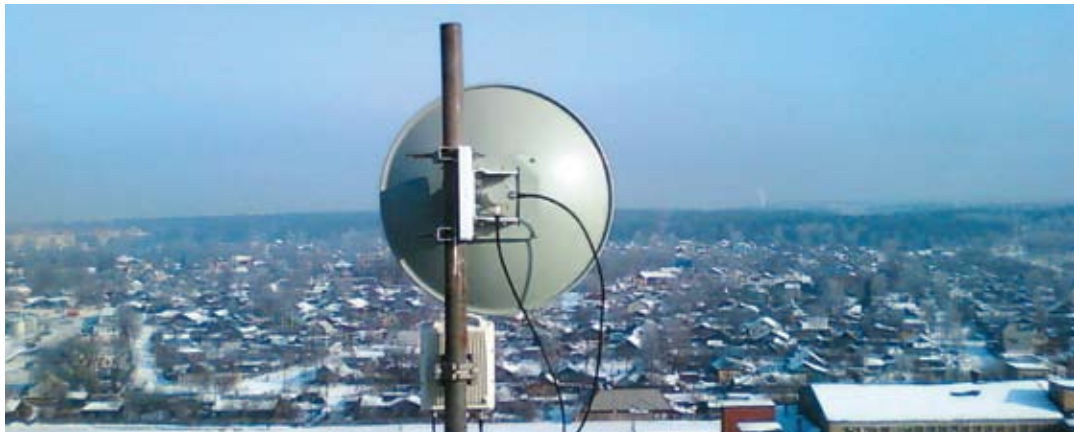
Передача IP и TDM при экстремальных температурах, Россия (Якутия)