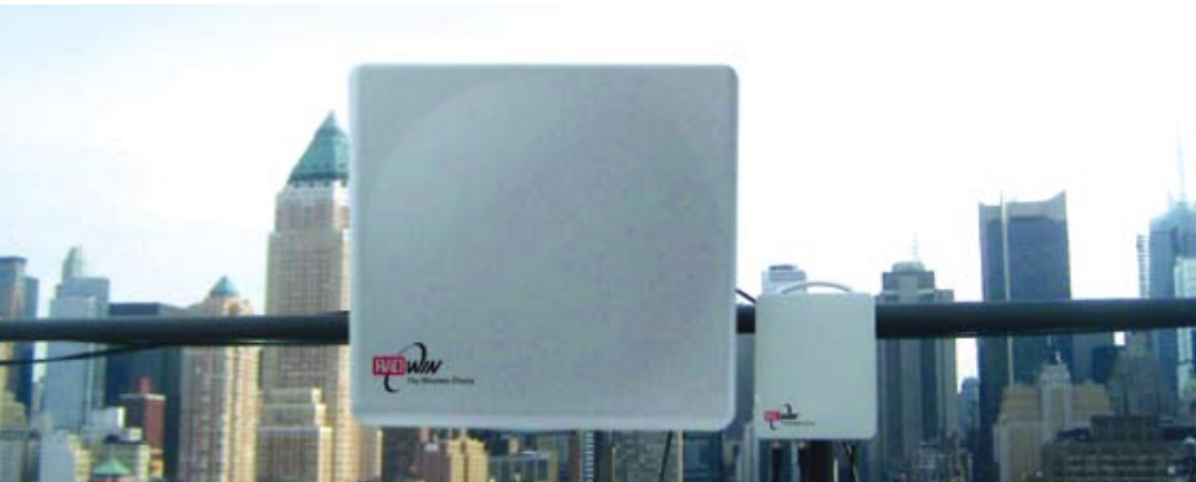
Работа в условиях сильной интерференции, Нью-Йорк, США

Создана для приложений IP и TDM высокой емкости