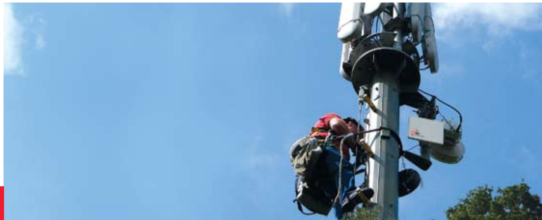
Транспорт в сети сотовой связи, США

Семейство RADWIN 2000 включает в себя беспроводное широкополосное оборудование для работы в лицензируемых и не подлежащих лицензированию частотных диапазонах, обеспечивающее суммарную полезную производительность до 200 Мбит/с. Оборудование поддерживает частотные диапазоны 2.3 ГГц, 2.4 ГГц, 3.4-3.7 ГГц и 4.8-6.06 ГГц. Компактные и надежные системы RADWIN 2000 передают традиционный трафик TDM (до 16 потоков E1/T1) и Ethernet, позволяя операторам плавно перейти от традиционных TDM сетей к полностью пакетным сетям IP.