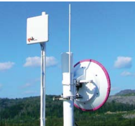
Связь для нефтегазового комплекса, Россия (Сибирь)

Радиосистемы повышенной емкости для транспорта в сетях IP и TDM