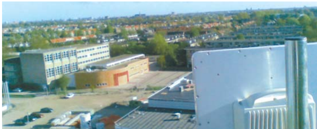
Транспорт в IP-сети, Нидерланды