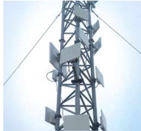
Сеть "множественная точка-точка"